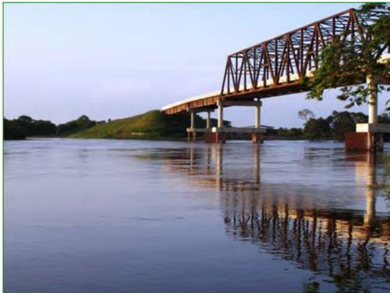
Puente sobre el Río Capanaparo